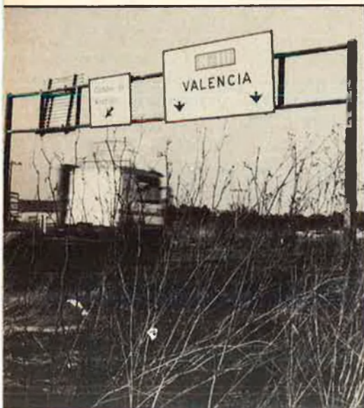
L'autovia València-Madrid podria estar acabada el 1992.

les que, per exemple, es faran en la xarxa Madrid-Andalusia, amb una velocitat superior als 200 Km/h. i que permetrà un estalvi de tres hores.