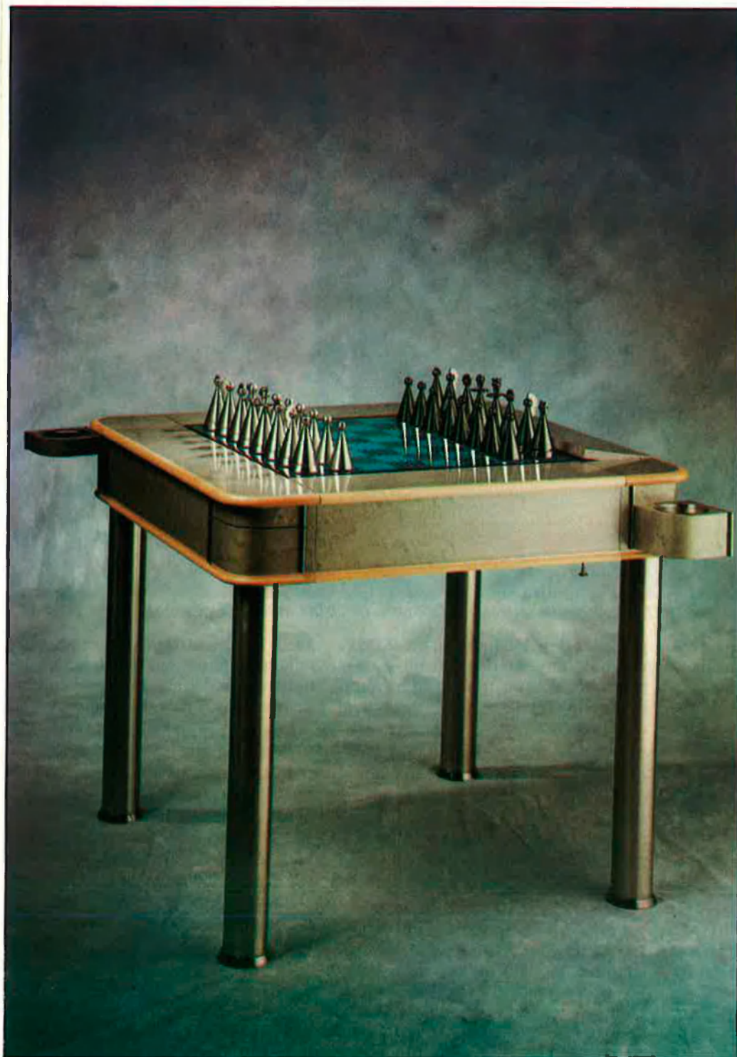
La baixada del dòlar ha contribuït a l'augment de les exportacions.

Paral·lelament les importacions també han experi-