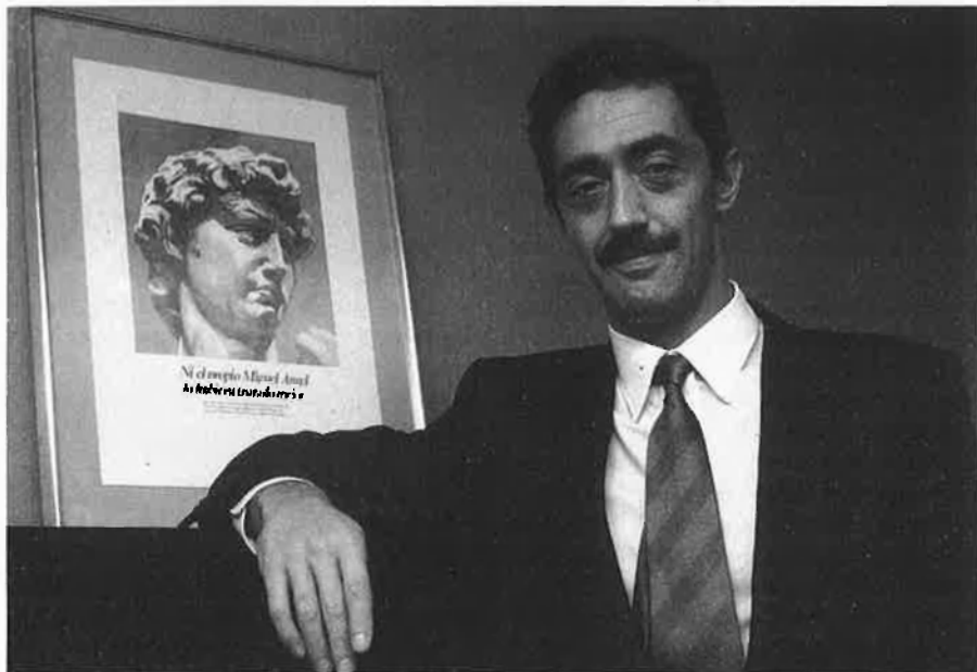
Segons Torres, la por a la Sida ha provocat un augment d'un 15 per cent en l'ús dels condons.

—Amb proves específiques. Es mira, fent servir un sistema de conducció elèctrica, la porositat i els forats que hi pugui haver. Aquesta prova s'anomena d'impermeabilitat. Les altres estan relacionades amb la resistència del làtex, que és la matèria que es fa servir per fabricar-los. La que anomenem de resistència mecànica consisteix a estirar el condó fins que es trenca. Segons la força que s'hagi de fer, és apte o no ho és. L'altre és l'anome-