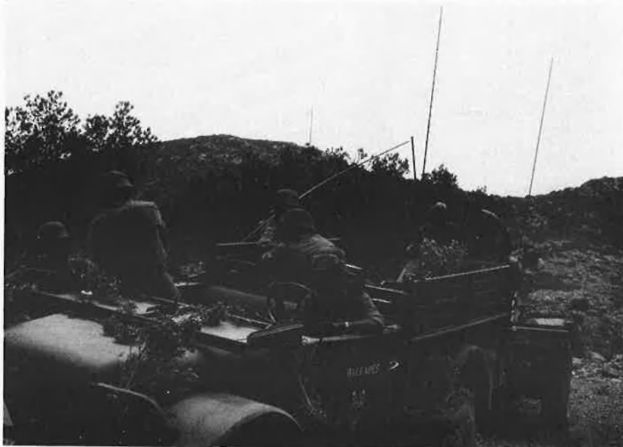
Cabrera: cruïlla d'interessos.