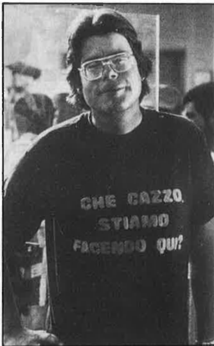
Stephen King ha convertit el terror en un gran èxit de vendes.

A continuació, ha seguit publicant sense defici, sota el seu nom o amb pseudònim (cinc llibres com a Richard Bachman), reiterant amb menys imaginació els pressupostos dels primers treballs. Cujo , Cycle of the were-wolf , Firestarter o Different seasons són Stephen King en baixa forma, convertit en un producte comercial al gust del