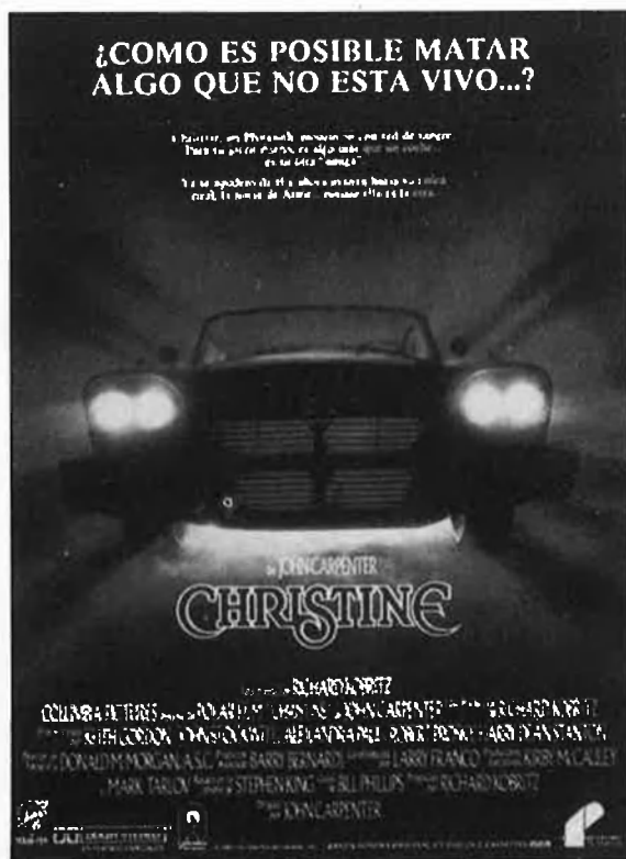
Quasi totes les novel·les de King han estat adaptades al cinema. «Christine» va aconseguir un gran èxit.