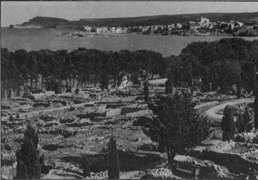
LA COSTA BRAVA, EN PERILL DE DEGRADACIÓ