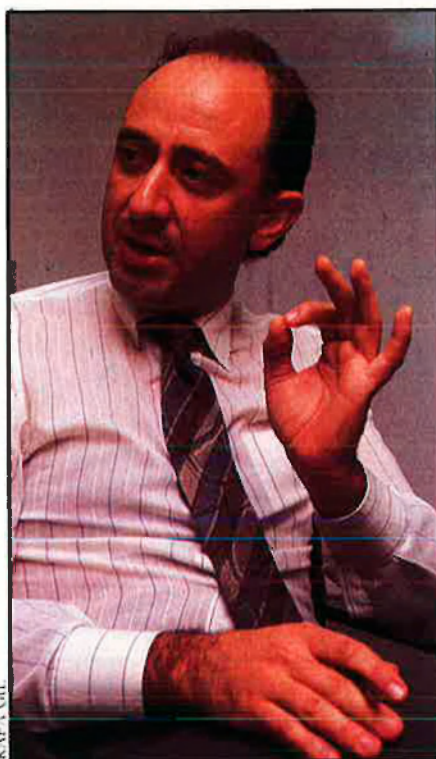
El 60% del Parc Tecnològic de València serà zona verda.

—Es pot parlar d'empreses de dos tipus: unes, de les anomenades sector terciari avançat, és a dir, enginyeria, consultoria, software aplicat, màrque-