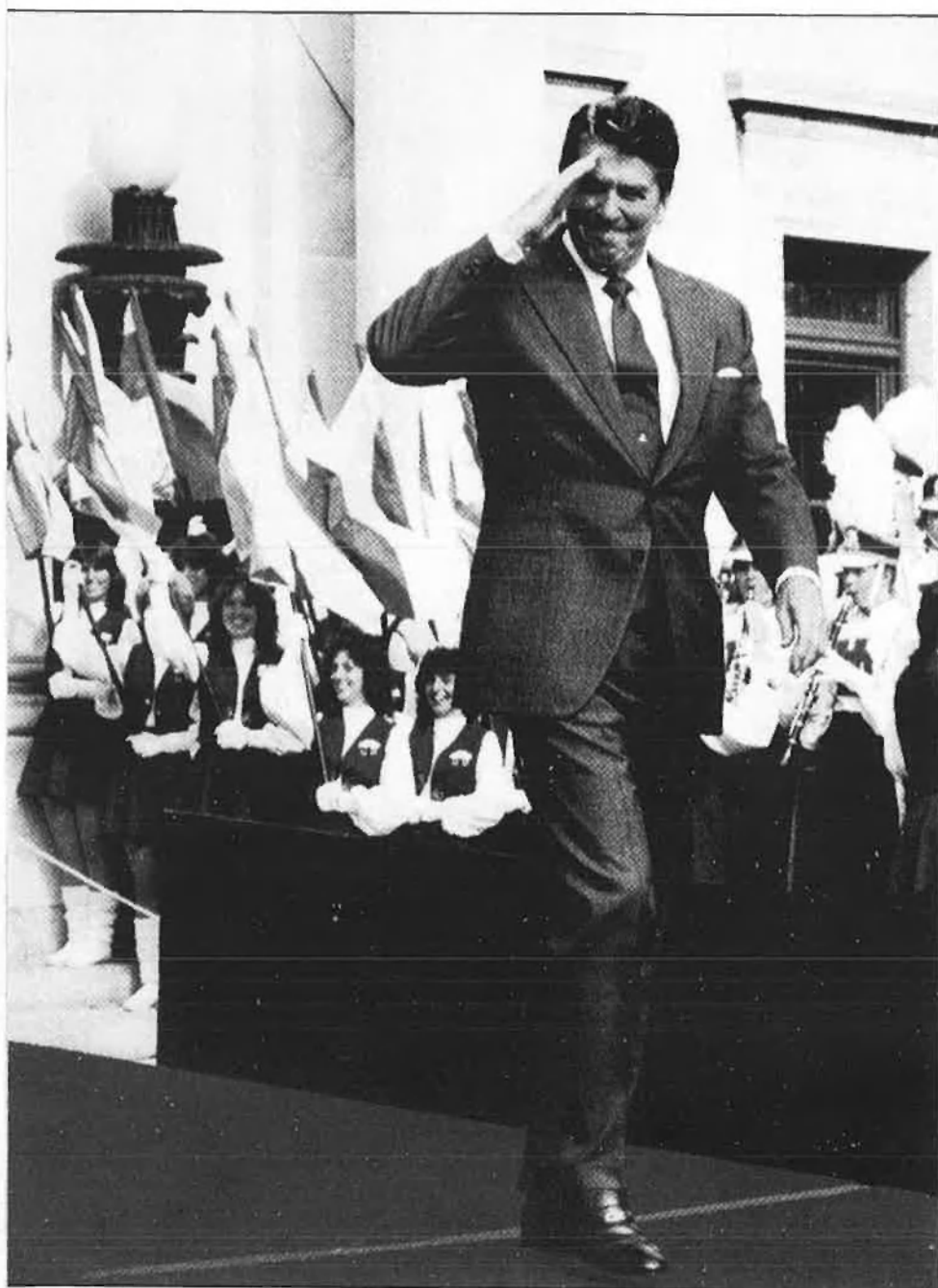
Reagan va saber, al llarg de vuit anys, aixecar la moral perduda durant el mandat de Carter.

H a canviat Reagan els Estats Units? Aquesta és la pregunta que s'han fet els principals mitjans d'informació nord-americans la setmana abans que George Bush assumís la presidència en una protocol·lària cerimònia celebrada a Washington. Ara, vuit anys després que aquell mediocre actor i bon governador de l'estat de Califòrnia substituís a la Casa Blanca un desacreditat Jimmy Carter, és l'hora de fer balanç d'un període republicà que ha inaugurat una etapa de saludable distensió en les relacions internacionals, propiciada, cal dir-ho, per la voluntat i necessitat del leninista Mikhaïl Gorbaxov de tirar endavant les reformes polítiques i econòmiques indispensables per a la supervivència del socialisme a la Unió Soviètica.