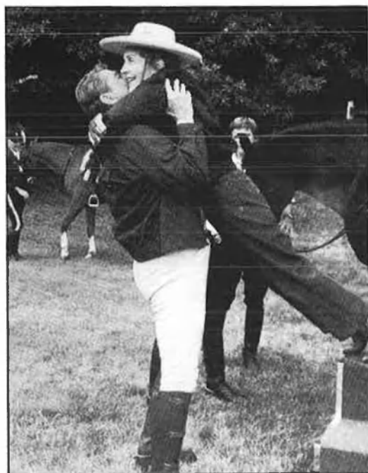
Imatge de la felicitat de tot un poble, els Reagan van ser prolixos en aquesta classe de manifestacions.

Segurament començar de nou i inventar un nou mite, una nova imatge. Però em tem que serà difícil oblidar Ronald Reagan. Oblidar el pànic que li teníem. I acostumar-nos a saber que també els indis han estat vençuts per aquesta mala peça. □