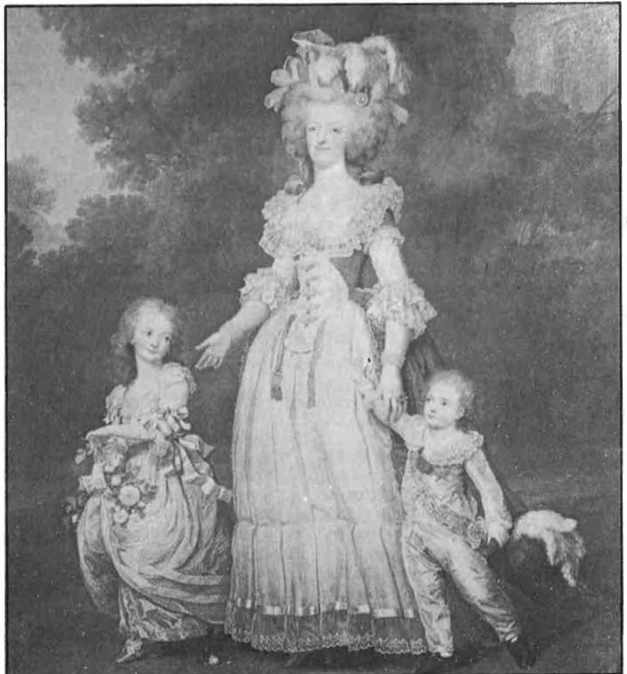
Maria Antonieta (1755-93) amb els seus fills.

Ben segur que aquest any l'anunci de nous actes commemoratius serà constant als Països Catalans. Tot i així, l'impacte, sobretot al País Valencià, és ínfim comparat amb el ressò que té a França, no endebades la França que avui coneixem és filla d'aquest moviment revolucionari. Ells saben d'on vénen i on van i ja han començat a engegar la maquinària del consumisme. □