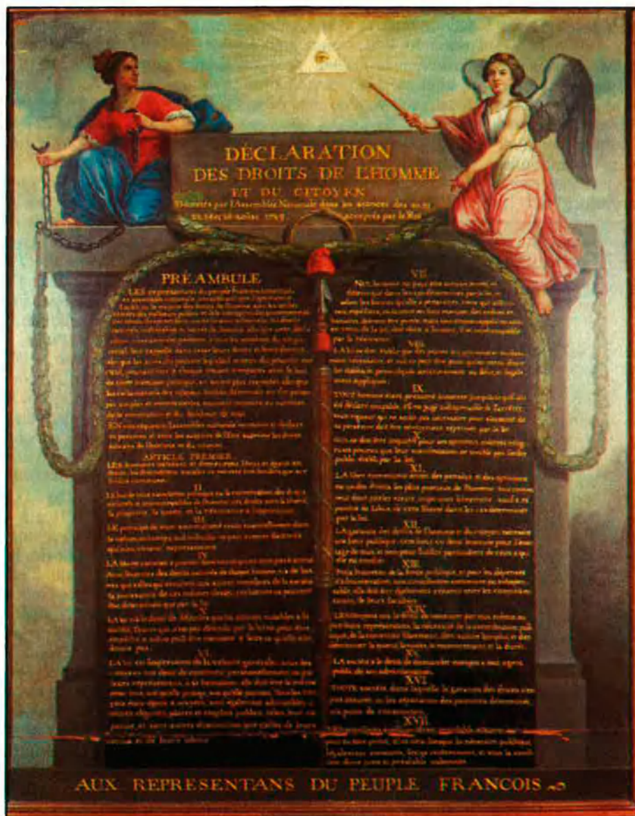
ENTRE LA COMMEMORACIÓ I LA REVISIÓ HISTÒRICA