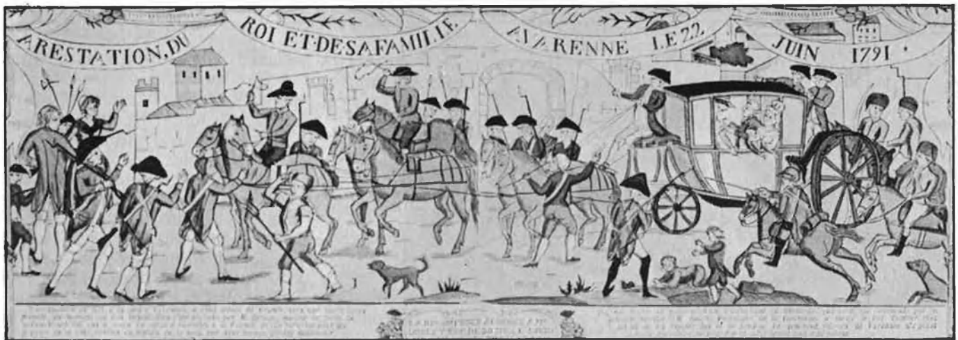
Detenció de Lluís XVI, a Varennes, juny de 1791.

Commission internationale pour le bicentenaire, el Departament d'Història moderna i contemporània de la UAB, l'Institut Francès de Barcelona, la Societat Catalana d'estudis històrics i la Caixa de Catalunya organitzen tres importants col·loquis internacionals sobre el tema: «El jacobinisme al Midi Francès, la Toscana, Catalunya i Espanya (1789-1837)» és el tema del primer col·loqui que se celebrarà a la Universitat Autònoma (maig), a la Universitat de Florència (juliol) i a la de Montpeller (agost/setembre), el segon col·loqui «La revolució francesa i el procés revolucionari a Catalunya» se celebrarà a l'Estudi General de Girona el desembre vinent i el darrer, sobre «Revolució i Socialisme», tindrà lloc també al desembre, a la UAB, i aprofitant la coincidència de dates amb el centenari de la II Internacional parlarà de l'empremta dels diferents projectes revolucionaris en el moviment obrer català i espanyol.