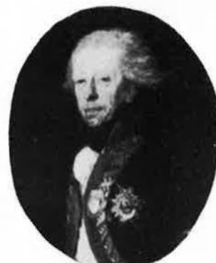
Antonio Ramón Ricardos.