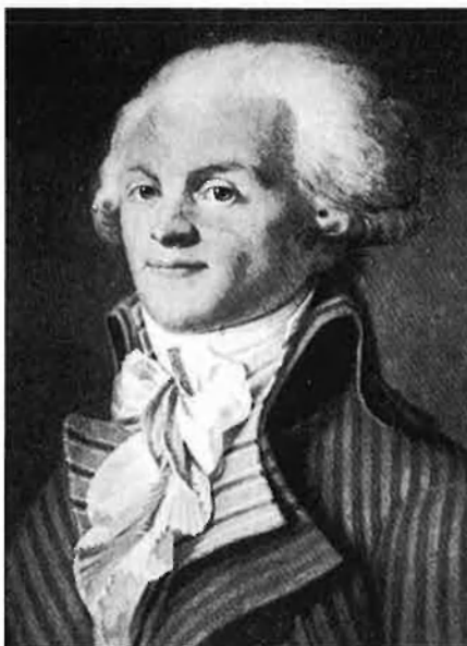
Robespierre, cap jacobí que instaurà el règim del terror.

La retirada es farà molt lentament cap al sud del Pirineu, mentre a Perpinyà s'estableix oficialment el règim