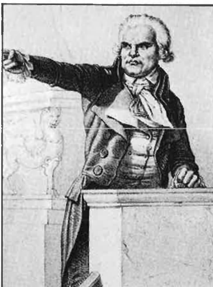
Jacques Danton, polític francès partidari de la lluita revolucionària contra la monarquia.