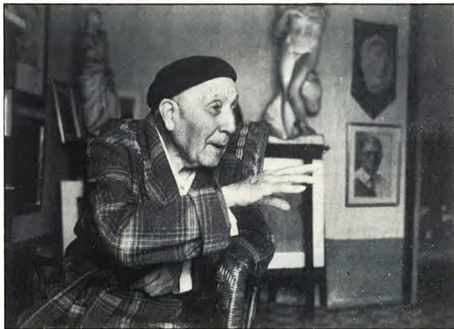
Durant els últims anys de la seua vida va viure dels compradors furtius que anaven a veure'l.

blasquista, els últims anys de la seua vida, empobrides les seues facultats —mig cec, sense pols per a pintar, etc.— i sense massa amics, sobrevivia dels compradors furtius que passaven, quasi clandestinament, per la seua casa. Sense notícies de la seua família —els seus dos germans havien mort abans que ell— va morir, després de dos anys de malaltia, a l'Hospital General de