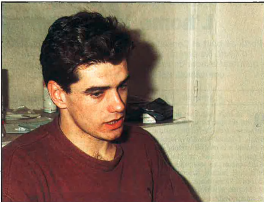
«Un ha de rebre bufetades, si te les expliquen no valen per a res».

Respecte a Sábado Noche , ha estat la gran frustració de la meua carrera, perquè no tenia ningun mèrit especial el que jo feia al programa; ara bé,