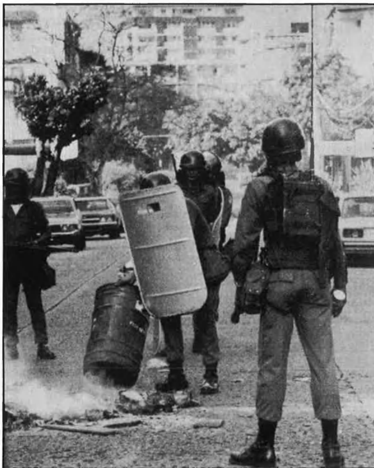
L'arribada de la democràcia no acabarà, en la majoria dels casos, amb la violència.

d'horrible gestió del president Alan García. A Brasil, s'estan definint els candidats. És més que probable que la batalla final es redueixi a Leonel Brizzola, del socialdemòcrata Partit Laborista Brasiler (PLB), un candidat del governamental Partit del Moviment Democràtic Brasiler (PMDB) i un altre de l'esquerra Partit dels Treballadors (PT), que ja domina l'alcaldia de São Paulo (15 milions d'habitants). A Xile, es buscarà substituir al dictador Augusto Pinochet. Hi podria haver tres candidats: el demòcrata-cristià Patricio Aylwin, amb el suport de les forces de la Concertació pel No del passat plebiscit presidencial; un aspirant dels sectors governamentals, que podria ser Hernan Buchi, i una altre de l'esquerra marxista, probablement Luis Maira, si abans no s'arriba a un acord per unir-se al projecte d'Aylwin. □