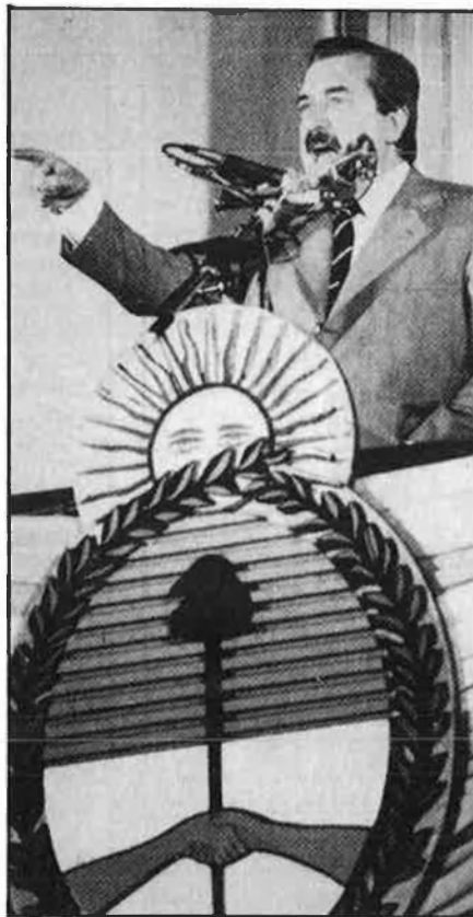
Raúl Alfonsín, president d'Argentina.

El mes de maig està atapeït de cites electorals: el dia 1, Paraguai; el 7, Bolívia i Panamà, i el 14, Argentina. Les eleccions que s'havien de celebrar el passat dilluns a Paraguai eren les primeres des de la caiguda del dictador Alfredo Stroessner, el 3 de febrer. Andrés Rodríguez, el general que enderrocà Stroessner més per motius personals que per anhel democràtic, ha permès una certa transparència en aquestes eleccions legislatives i presidencials. Rodríguez recull la innegable popularitat del Partit Colorado que ha governat amb Stroessner durant més de 40 anys i es presenta, segons les darreres estadístiques, com el favorit. El seu programa, poc renovador, incideix en «l'estabilitat política» del país i s'aprofita del recel dels paraguaians en votar altres opcions fins ara prohibides. És més que probable que el mateix Partit Colorado obtingui la majoria parlamentària perquè les lleis electorals adjudiquen els dos terços dels escons al grup més votat. La incògnita, tant per als paraguaians com per als analistes polítics, és el paper que obtindrà Domingo Laíno, líder del Partit Liberal Radical Autèntic (PLRA, centre),