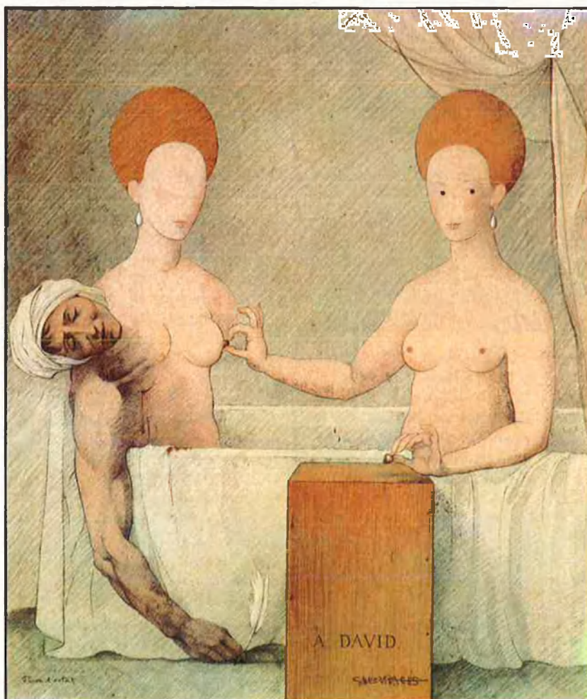
Josep Ma. Subirachs. «A David», 1989.

UNA IMPORTANT REPRESENTACIÓ DE LA PINTURA CATALANA ACTUAL COMMEMORA LA REVOLUCIÓ FRANCESA