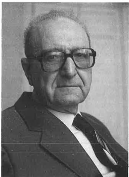
Roger Garaudy, filòsof francès.