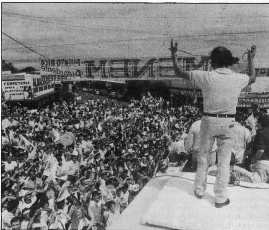
Alfonsín (dalt) i Menem (baix), cara i creu d'un país desesperançat i envaït per la crisi econòmica.

na. La segona, la pot apaivagar amb la repressió militar i dels grups de xoc, però la primera pot fer molt de mal a un país altament dependent de l'exterior. Les respostes a aquestes incògnites són tan variades com els punts foscos de la personalitat de Noriega. N'hi ha que opinen que el general podria convocar noves eleccions, però preparant una coalició més presentable, potser amb alguns elements de l'oposició, que fes innecessari el frau. D'altres, parlen d'un pacte amb l'Aliança Democràtica d'Oposició Civilista (ADOC) per desbloquejar la situació actual i poder