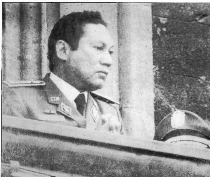
Manuel Antonio Noriega.

Menem, que durant la campanya electoral amb el menemòbil oferí tot el que es pot oferir, haurà de demostrar que els seus detractors no tenen raó quan parlen d'incapacitat. El repte és considerable encara que disposi d'un període de gràcia d'un any, el temps en què un electorat fidel pot començar a perdre la paciència si no veu resultats tangibles. El cas és que pocs creuen que hi hagi una fórmula per remuntar la crisi econòmica quan l'especulació i la desmoralització ho han envaït tot. Al contrari d'Angeloz, el candidat peronista, parlà de nacionalitzacions, representant la política populista de Perón. Menem prometé una millora salarial, de difícil aplicació en aquesta situació d'inflació, i una actitud més ferma davant els organismes internacionals de crèdit: Banc Mundial i Fons Monetari Internacional (FMI). A partir d'ara comença el període en què Menem haurà de demostrar que les promeses te-