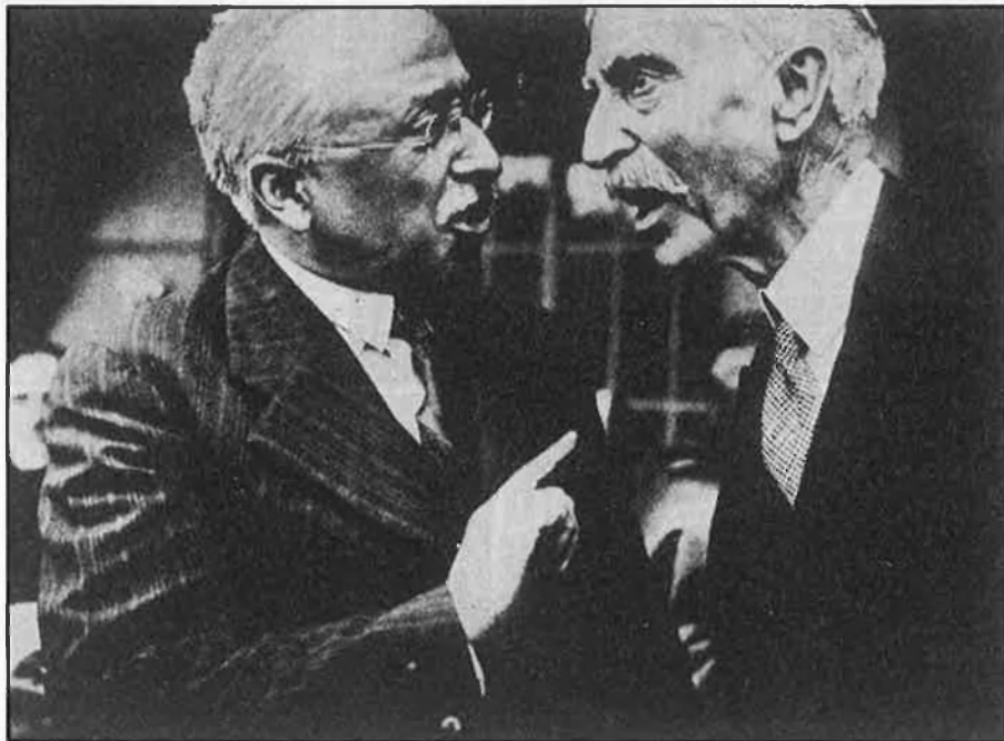
Niceto Alcalá Zamora i Francesc Macià.