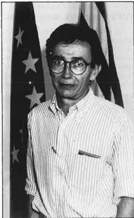
Xavier Rubert de Ventós.

lític del tot atípic: va començar militant al FOC, amb Narcís Serra, i ha acabat a l'olimp de l'uropeisme després d'una legislatura al Congrés dels Diputats. Al costat de Josep Verde i Joan Colom, serà la veu catalana dins del nombrós grup socialista d'Estrasburg.