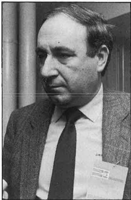
Juan María Bandrés.