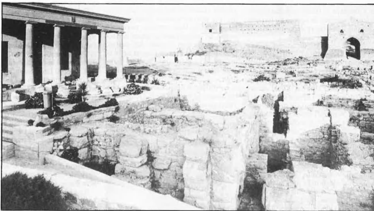
ELS PLANS DEL PATRIMONI CULTURAL PER A SALVAGUARDAR EL PASSAT