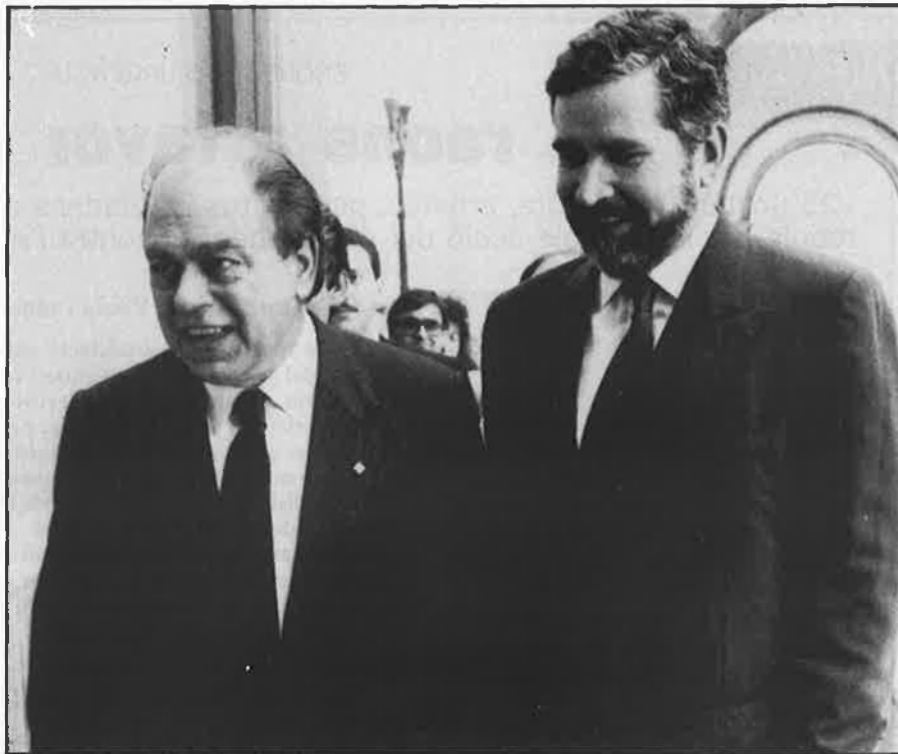
Malgrat els somriures dels presidents Pujol i Lerma durant l'encontre a Castelló, i del desig del primer que TVV es veja a Catalunya, el cert és que aquest projecte pot ser inviable.

ben paradoxal. Mentre que hi ha tots els pronunciaments a favor que la TVV arribe també a Catalunya, inclús amb la col·laboració de dos governs auto-