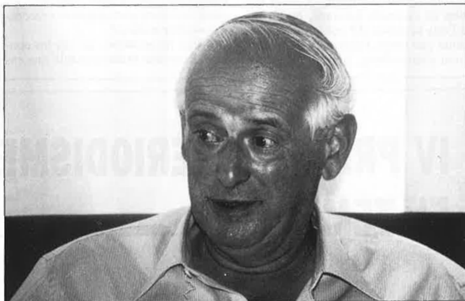
«Quan estam a les fosques és quan som més sants».

—El verd, per a mi, és sinònim de vida. A ca nostra tenim un corral ple d'arbres. Des d'allà on escric, el veig.