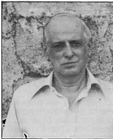
«Som socialista, però no puc acceptar en Felipe González».

—Amb l'amor, deu ser amb el que ha canviat més l'humà, perquè és molt modern, això de l'amor. Durant milers d'anys, l'amor era una cosa sagrada. La unió d'homes i dones era molt sagrada. Antigament, quan no existien els déus i tot eren deesses, figura't com era de sagrat l'amor que hi havia pobles de quaranta habitants, on un pic a l'any la deessa del poble pujava damunt una trona, s'alçava les falces i tohom s'agenollava, figura't si era sa-