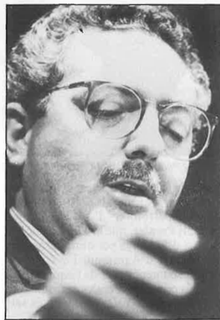
Pere Agramunt, el gran triomfador.

El viatge de Quirós per la llista popular tan sols és una anècdota en el rebombori de noms i llocs que ha viscut el PP les dues últimes setmanes. Així, el dirigent liberal Carlos Manglano s'evaporà d'aspirant al Congrés i al Senat, i quedà a la reserva fins a les autonòmiques; el president provincial de València, Ignacio Gil Lázaro , que rondava pel segon lloc a la Cambra Alta, ni figura a la llista i, per voluntat de Manuel Fraga i Àngel Sanchis Perales , entra de cap de llista a la papereta secundària del Senat. D'altra banda, i més sorprenent encara, Juan Antonio Montesinos , un fidel seguidor de les consignes de Génova-Madrid, no menys que president de facto dels populars valencians, com a president de la gestora que provisionalment controla l'organització, ha acabat de tercer en la formació alacantina al Congrés, darrere d'un nou cuñero , l'ex-secretari general adjunt del PP, Federico Trillo , i del també diputat com Montesinos , José Cholbi , l'home de ferro de la Marina Alta. Montesinos ha consentit que Trillo fóra primer, i no ha tingut més re-