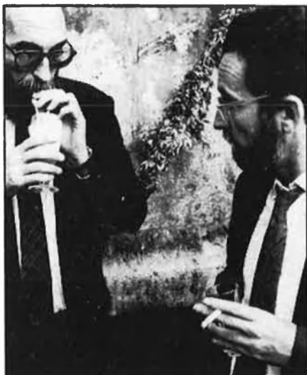
Escarré i Auernheimer, ecologia a mansalva.