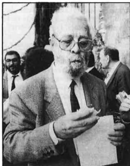
Berlanga, arguments de pes.

Cada 9 d'octubre la Presidència de la Generalitat valenciana fa el miracle de les pataquetes i els canapès. Una deferència gastro-social de la institució a unes quantes personalitats de la vida valenciana. Una gratitud calçada, amb pretensions magnànimes, de l'habitual mocadorà amb què els enamorats obsequien les enamorades en el dia de Sant Dionís. Això passa a les 13.30 hores i en la plaça de Manises, annexionada al Palau de la Generalitat per a l'ocasió i habilitada amb monumentals taules de convit, profusió de cambrers amb jaqué i un tapís de murta fina que posa a prova l'equilibri dels cambrers i la resistència dels seus jaqués en la tintoreria.