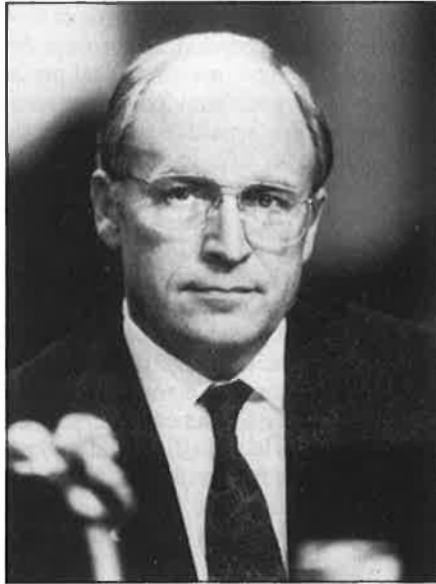
Richard Cheney, ministre de Defensa dels EUA.

Si és cert que a curt termini es veurien perjudicats els balanços i els llocs de treball de la indústria d'armament, també ho és que en una perspectiva a més llarg termini la conseqüència d'una major concentració en la producció de béns de pau només podria ser beneficiosa per a l'economia nord-americana.