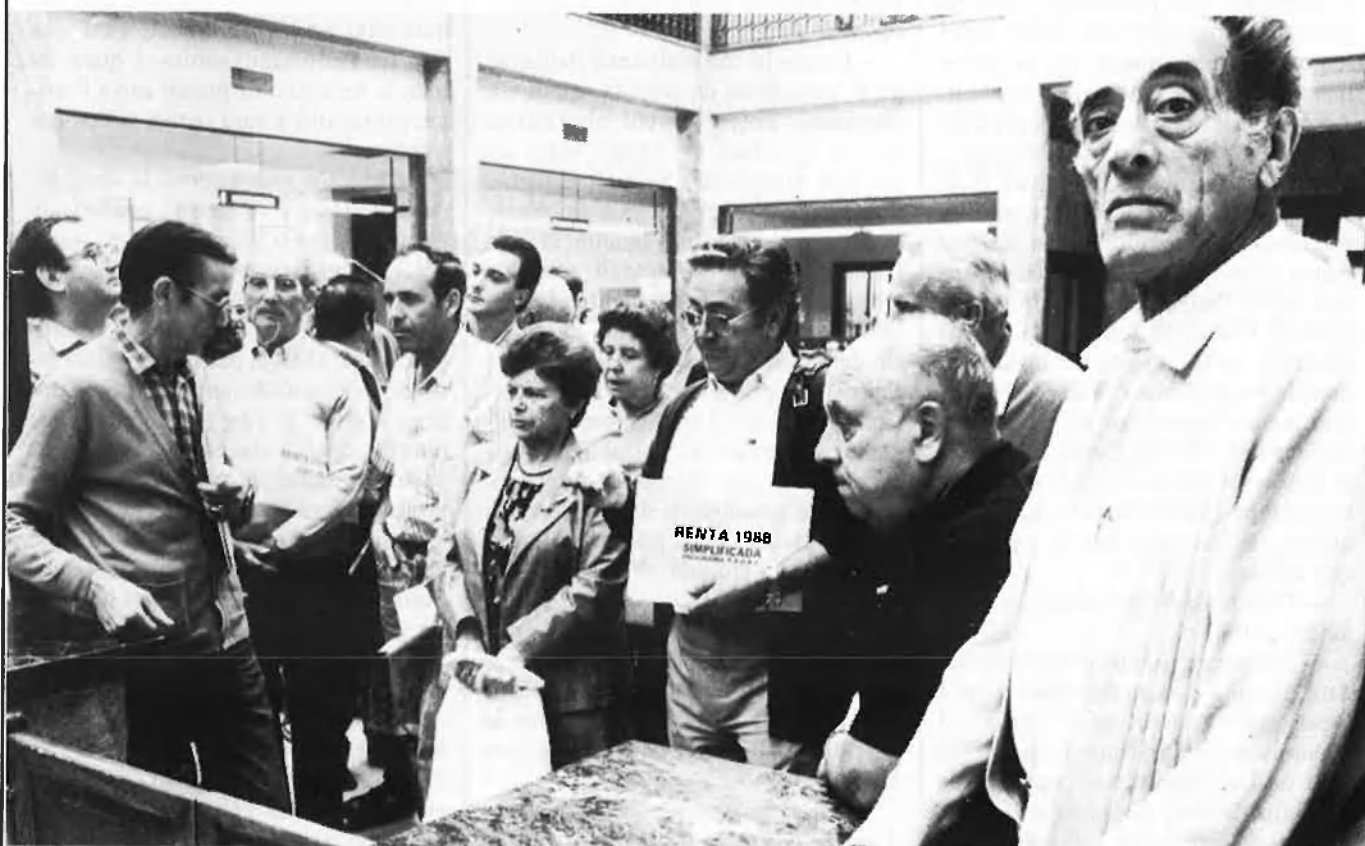
Seu de la Delegació d'Hisenda a València.

Aquest embargament s'ha vist seguit d'altres. La clau de l'enfrontament té connotacions jurídiques: mentre els objectors exigeixen una llei que reconegui el dret a l'objecció fiscal, en base a l'article 16.1 de la Constitució, un article fonamental sobre la llibertat de consciència, l'estat esgrimeix l'article 31, on s'especifica que tots els ciutadans han de contribuir a les càrregues públiques. Albert Vicent