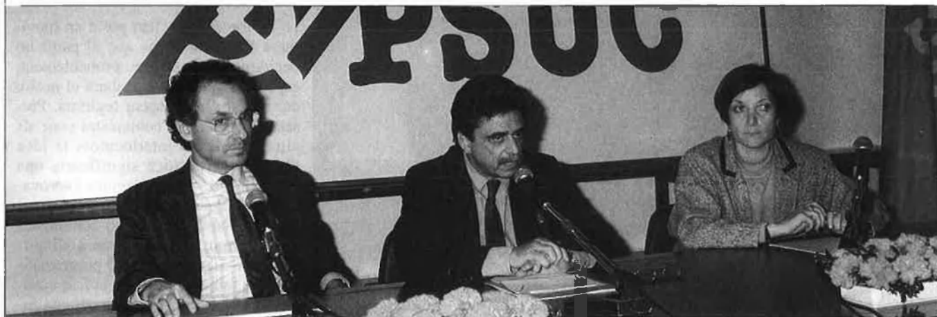
"El PCI tractarà de concretar formes modernes de crítica que no siguin abstractament ideològiques".