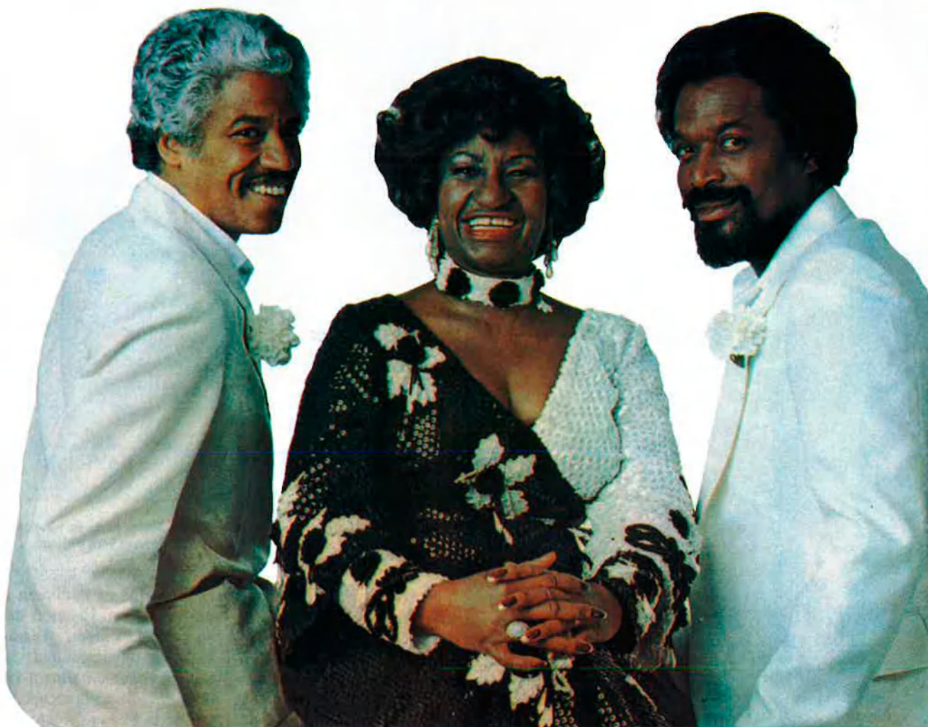
La salsa és una moda més: "sofrito na má" si emprem la vella expressió antillana.

Els múltiples contactes amb la música d'aquests països i amb altres de tradició anglosaxona com el blues , el soul o el jazz produeixen dins de la salsa un complex fenomen de fusió i mestissatge que dona lloc a tota una sèrie de corrents i estils de difícil classificació.