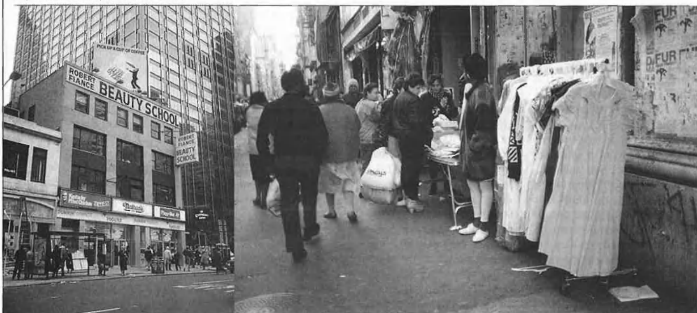
A Broadway es pot trobar, com a qualsevol mercat, els vestits passats de moda més inversemblants.

clients i maniquins que semblen de veritat. Tendes de roba usada, barrets de pel·lícula, jueus, el músic de la cantonada, aparadors de fruites que brillen tant que semblen de plàstic, restaurants amb palmeres, d'altres amb barrets de mexicans il·luminats, i l'incondicional homeless que et demana "change, please, change..."