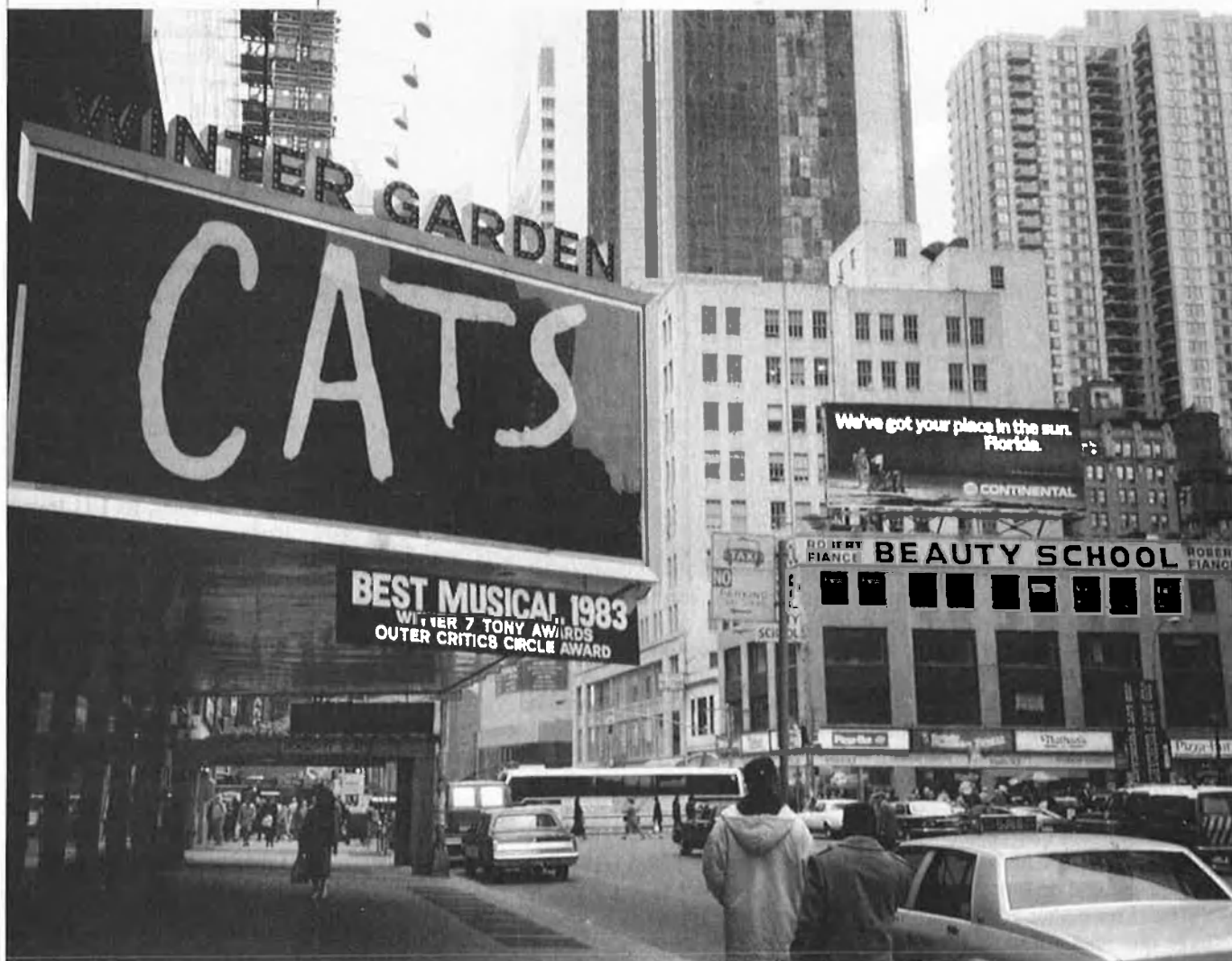
B'way, el carrer més llarg del món, és com un mercat d'ocasió on pots trobar de tot.

New York Times dona nom a aquest sector de B'way des de 1905. Times Square havia estat punt de reunió de les grans festes i esdeveniments dels novaiorquesos: resultat d'eleccions, parades per Thanksgiving Day, les dotze campanades de l'any nou... Ara, encara que no tan lluit, la gent continua esperant que el rellotge acabi de tocar, per desmarxar-se una mica sota la mirada malèvola del ca-