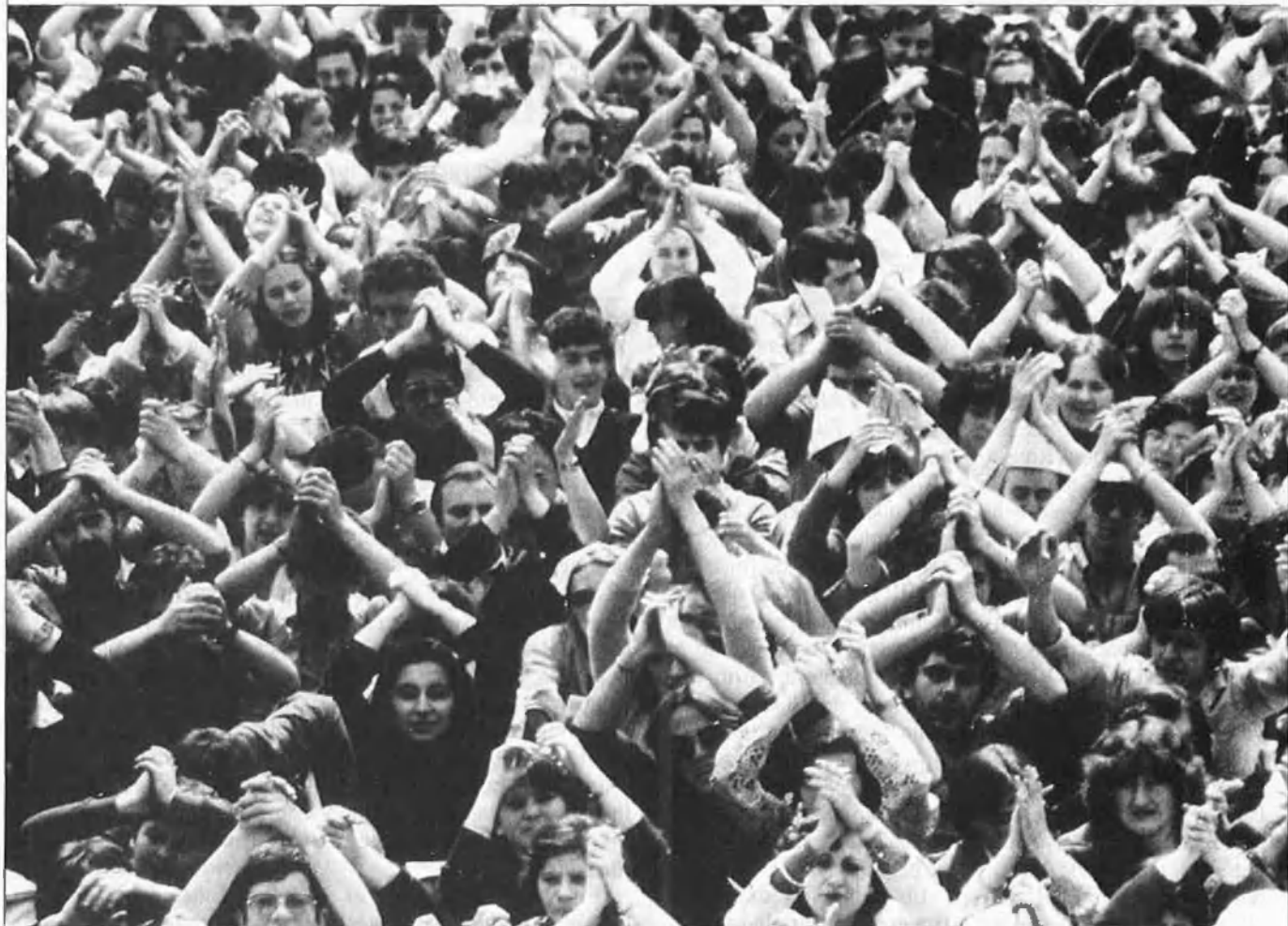
Conceptes com solidaritat internacional adquireixen un nou protagonisme a mesura que s'acosta el 2000.

argumentacions científiques que qüestionen aquestes premisses, però, en qualsevol cas, el que sembla ara per ara irrefutable és que la capacitat de la Terra d'absorbir residus contaminants no és il·limitada i que ens trobem en un punt relativament proper a la seva saturació a partir del qual pot quedar malmesa irremissiblement la qualitat de vida.