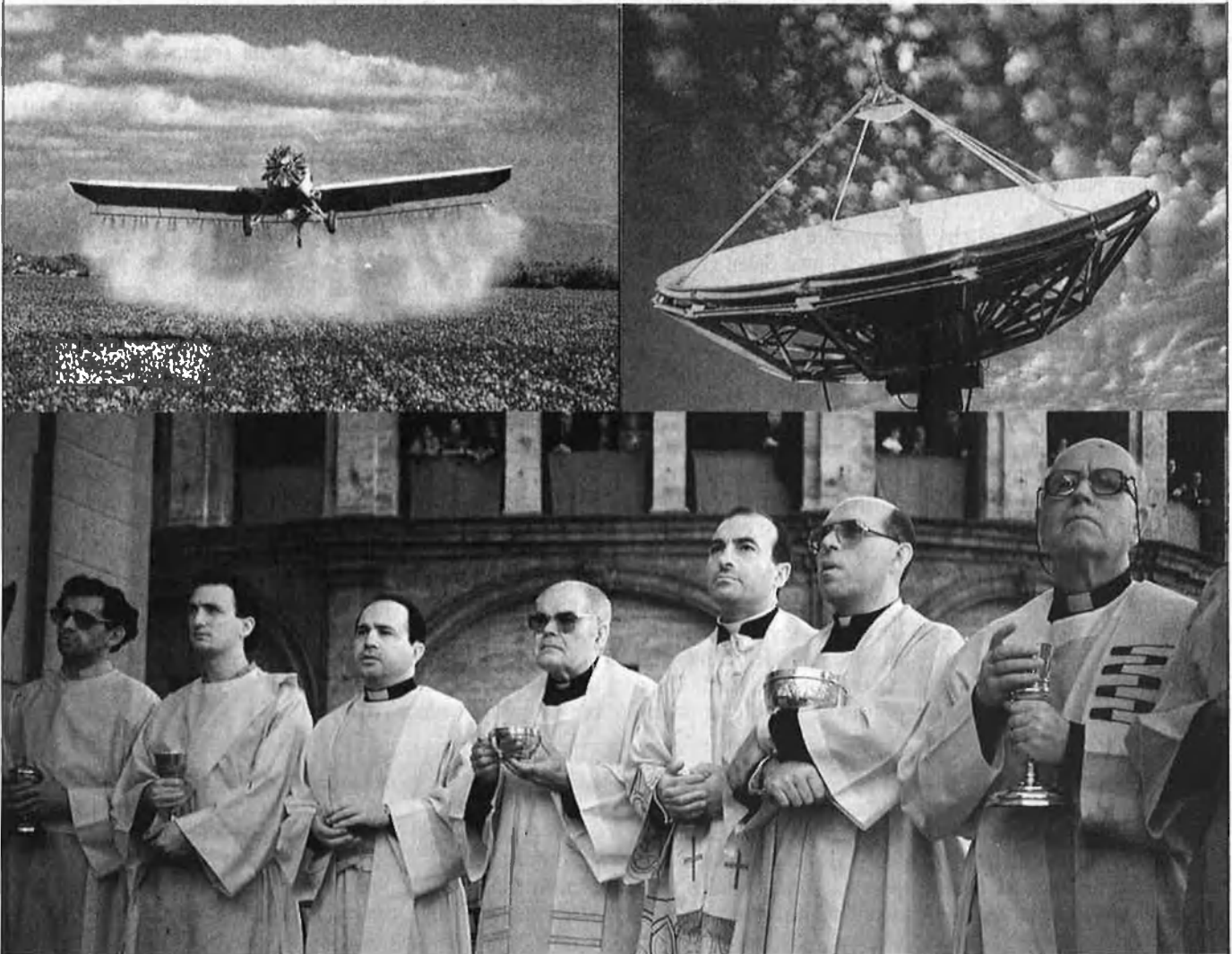
El nou mil·lennisme parla d'emergència ambiental i de racionalisme científic aferrissat.

Certament no tenen avui gaire credibilitat aquestes velles teories, però, no obstant, resulta indubtable l'existència entre els cercles il·lustrats europeus d'un nou mil·lenarisme, tal com queda reflectit en publicacions de prestigi del nostre continent com ara la Stampa o L'Espresso . Filòsofs com Sergio Quinzio parlen ja d'emergència ambiental: avanç del desert, forat a la capa ozó, inundacions catastròfiques freqüents, deforestació, etc... signifiquen per a Quinzio, un filòsof de profundes conviccions cristianes, que s'acosta una situació apocalíptica a escala mundial només superable amb la intervenció divina. Contràriament, Norberto Bobbio, molt més laic i racionalista, manifesta