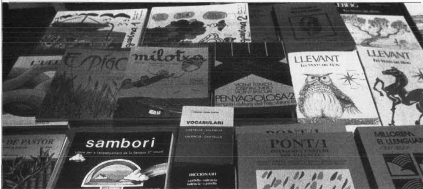
Cal demanar-nos si podem continuar instal·lats en la dimissió d'obviar la nostra pròpia història dels manuals escolars.