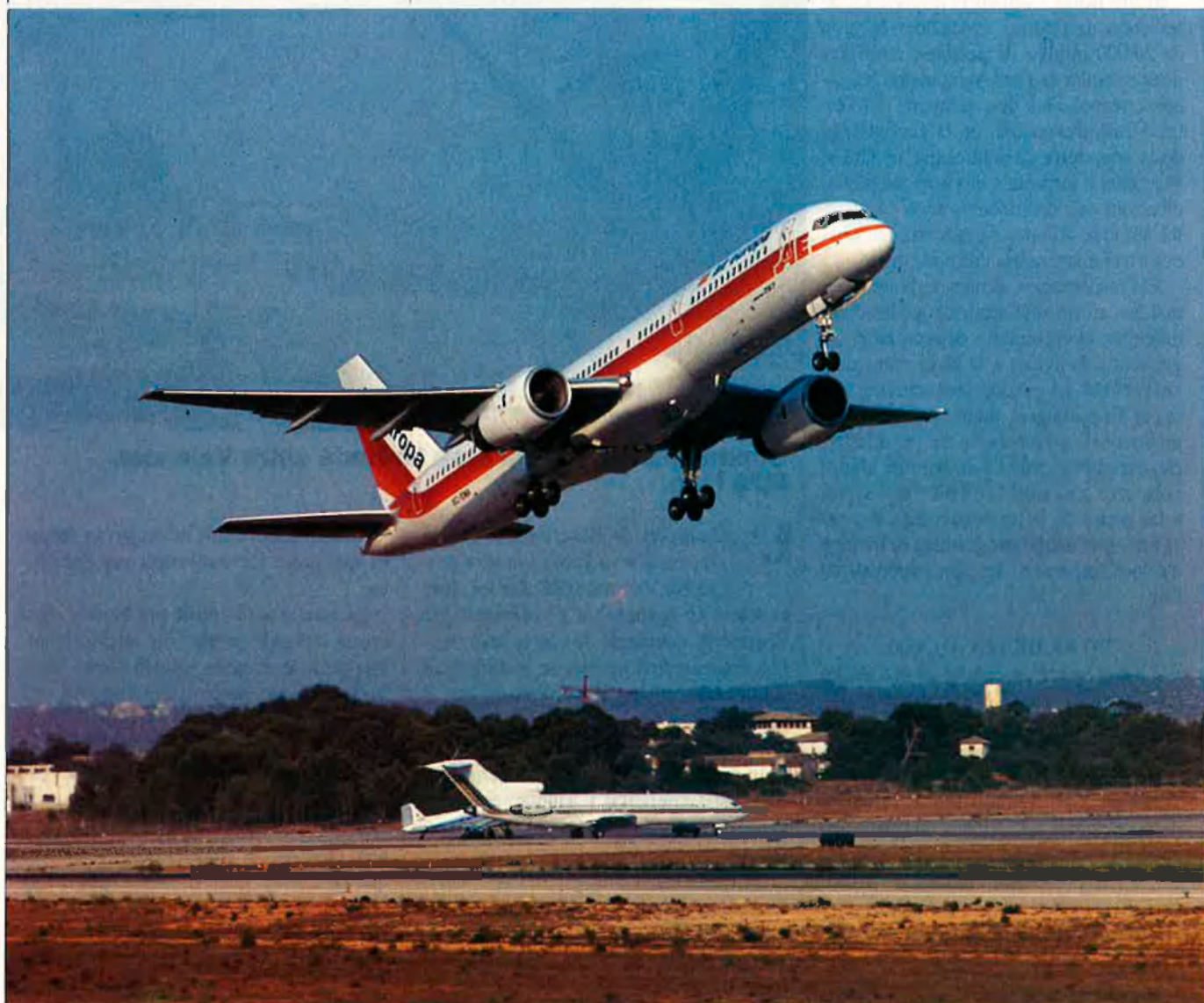
La xifra de 12 milions de passatgers anuals pot ser superada a partir del 1995.

afegit a les molèsties originades per l'actual reforma de l'aeroport i a les pròpies d'un espai aeri col·lapsat. Una visita al Prat aquests dies és prou significativa per a preveure un estiu càrdic, que batrà els rècords d'edicions anteriors, per molt espectaculars que fossin.