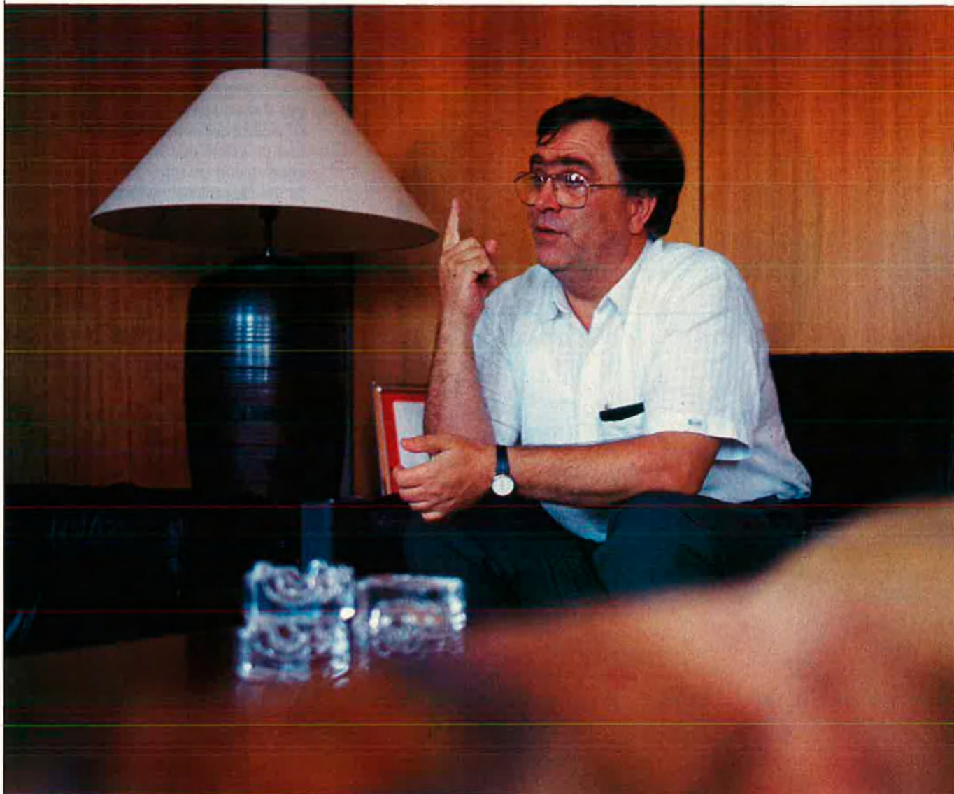
"És ben clar que hem d'anar cap a un fort procés de normalització".