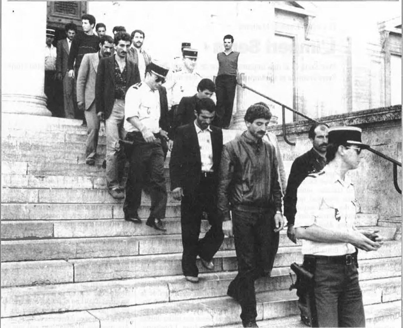
Un grup de turcs detinguts surt del Palau de Justícia de Perpinyà després de comparèixer davant del jutge. Utilitzaven una filera desmantellada l'any passat a l'Auda.