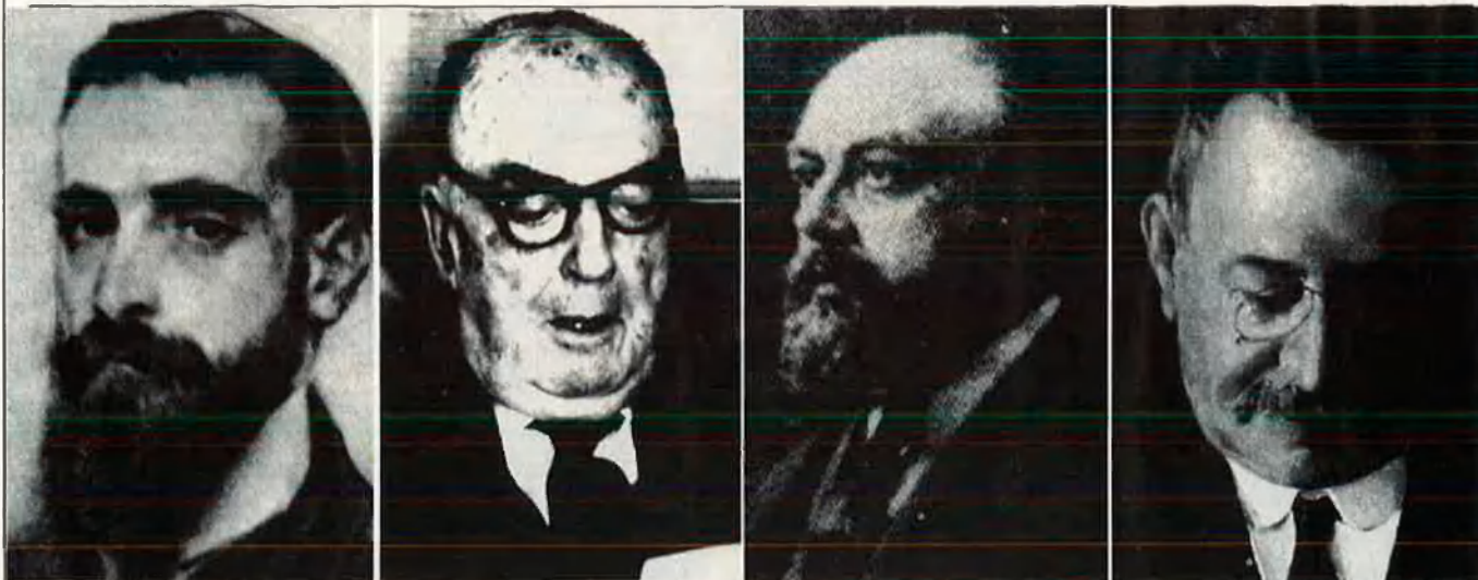
Francesc Cambó, Josep Carner, Miquel dels Sants Oliver i Enric Prat de la Riba.