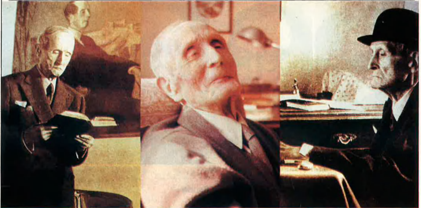
L'informe pot datar-se entre 1905, moment en què Azorín és enviat per ABC a Catalunya, i 1908, el període de diputat.

la seua biblioteca i la seua confessió d'haver llegit, entre altres, Àngel Guimerà, Apel·les Mestres, Carles Soldevila, Eugeni d'Ors, Ausiàs Marc, Carles Riba, Joan Maragall, F. Pi i Maragall i Martí de Riquer en versió original), sinó que va arribar a comprometre una obra teatral en català, Ifac , que, per diverses raons, mai no va arribar a materialitzar.