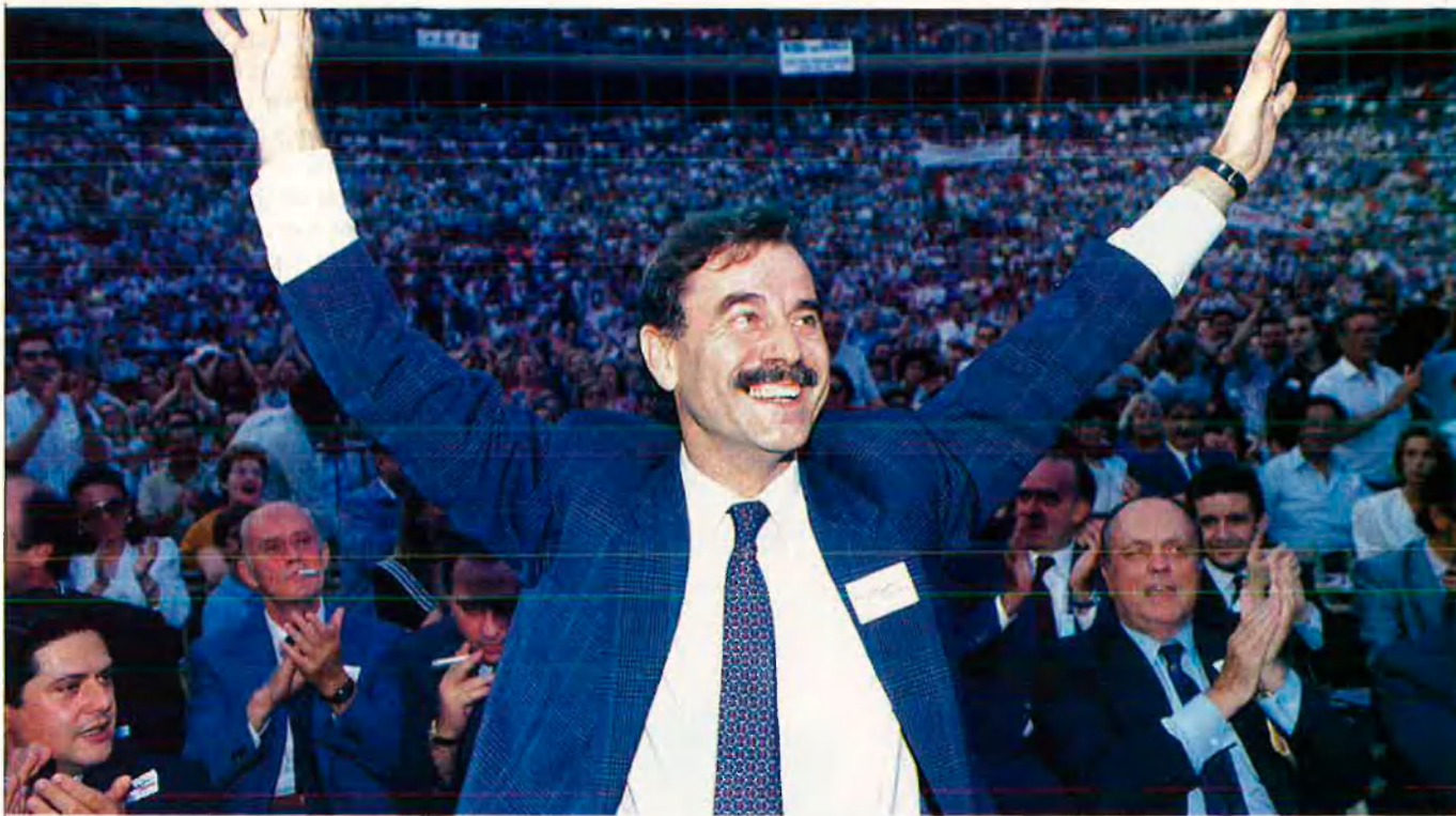
"València no té el pes polític ni econòmic que mereix".