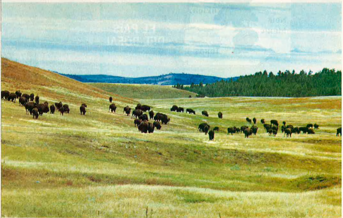
Parc Nacional de Wind Cave, Dakota del Sur.

Diversos científics i grups ecologistes dels Estats Units han iniciat una campanya de compra de terres en vuit estats de la regió del Midwest. El propòsit és crear una enorme reserva integral per als búfals americans.