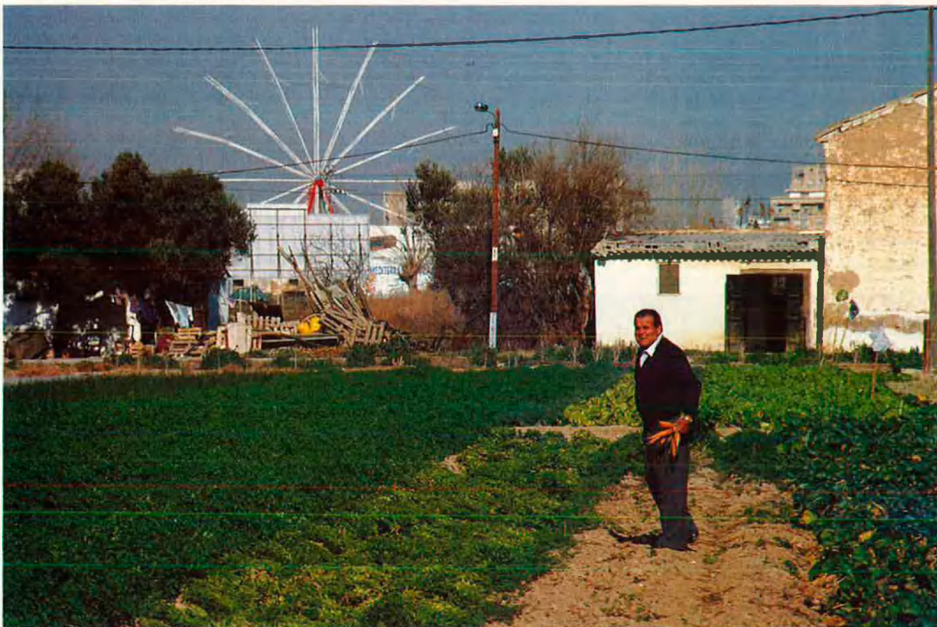
L'herència és una institució creada per a regular el transvasament de poders.