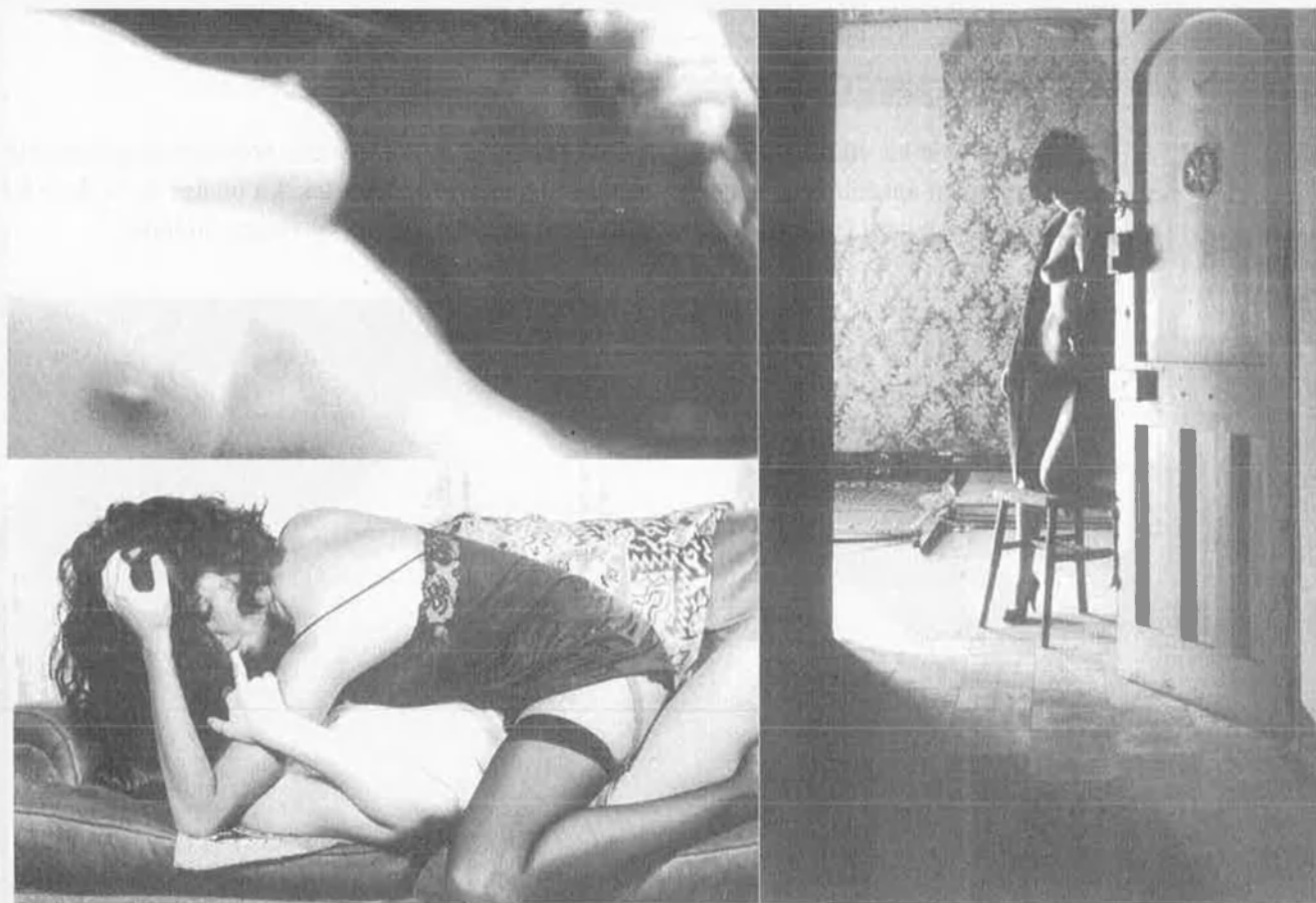
Sessións fotogràfiques per a col·leccions que es llegeixen amb una sola mà.