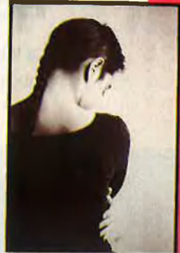
Columna llança, manté i expandeix un estil de fer cobertes.