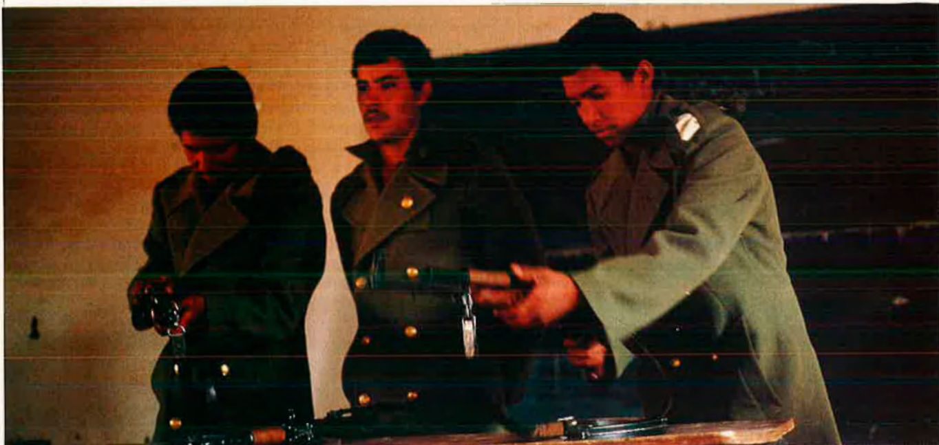
Escola militar del Front Polisario.