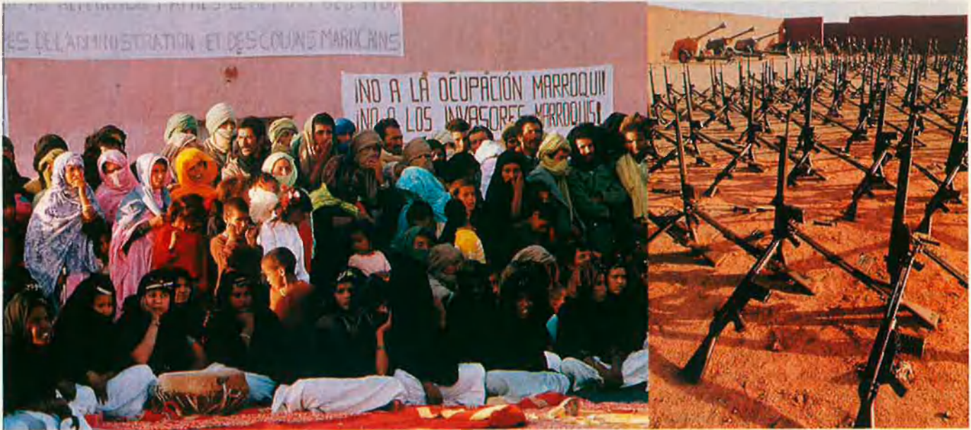
El poble saharià intenta que la seva lluita no caigui en l'oblit. A la dreta, arsenal d'armament capturat al Marroc.

Mentre que, en l'època del colonialisme espanyol, les dones no rebien cap mena d'educació, a la RASD tenen les mateixes oportunitats que els homes. Les escoles són recintes molt grans i amb una gran varietat de dependències, ja que els estudiants hi resideixen durant l'etapa de formació escolar. A l'escola 9 de Juny, per exemple, on estudien 1.050 alumnes, a més a més de tot allò necessari per a l'estudi i l'allotjament (aules, dormitoris i