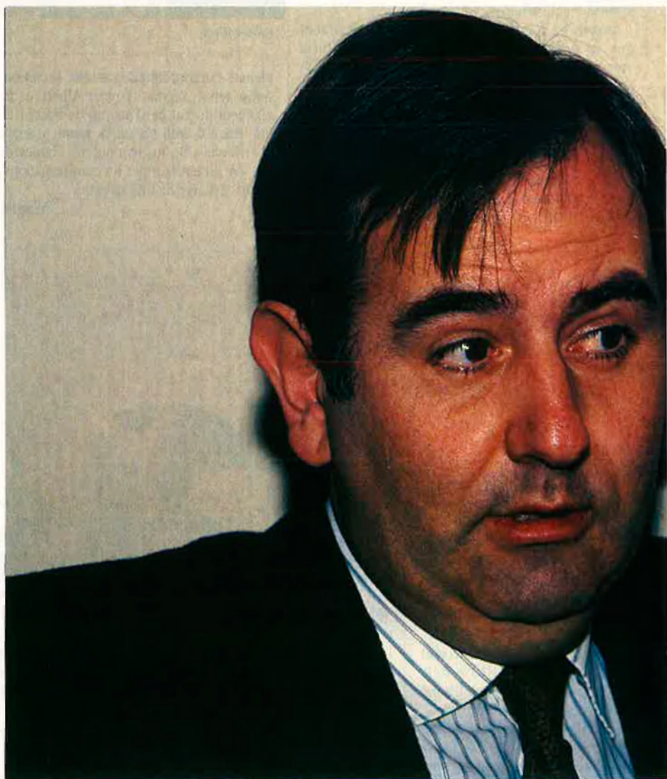
“Vull que hi hagi llum i taquígrafs en la meua actuació”.

El defensor del poble pot admetre queixes només en els supòsits en els quals el ciutadà planteja un conflicte amb una administració pública. És igual que sigui municipal, d'una diputació, d'una comunitat autònoma o de l'estat. Tampoc hi ha limitació pel fet que el ciutadà sigui espanyol o estranger. L'única condició és que es