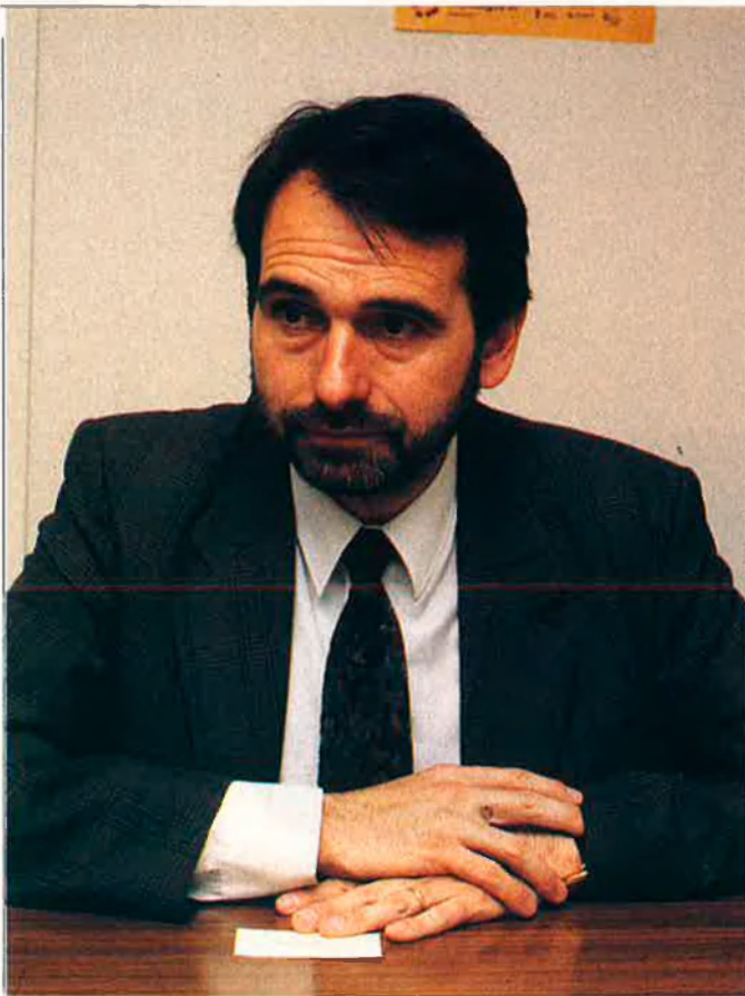
"Allò de marxar a provar sort amb el farcell a l'esquena s'ha acabat." J. MORERA

—Com una cosa absolutament necessària que s'ha de fer per millorar la formació, la seguretat social, la productivitat, etc. Si no, sempre hi