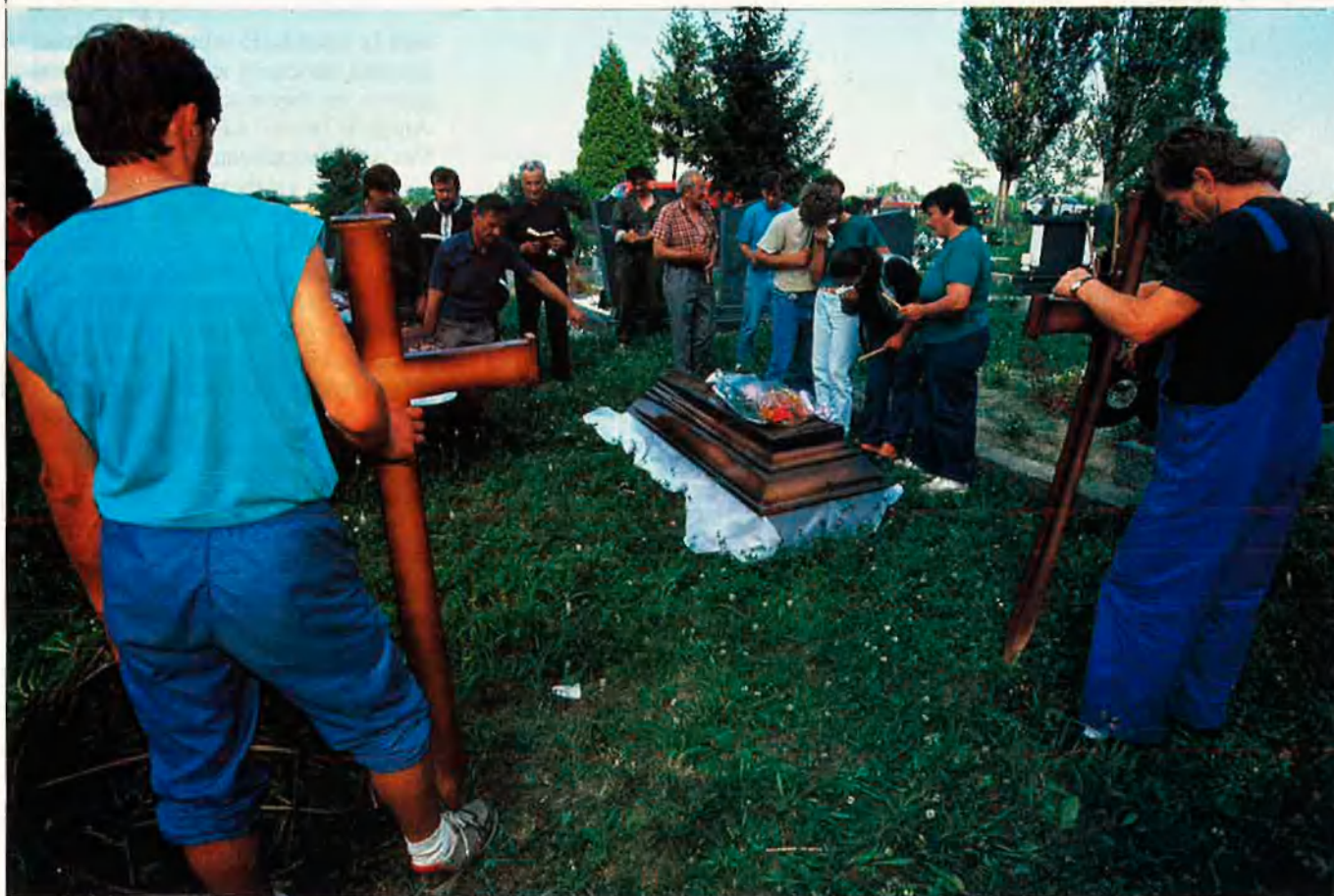
A Eslavònia, també ha arribat el no future .