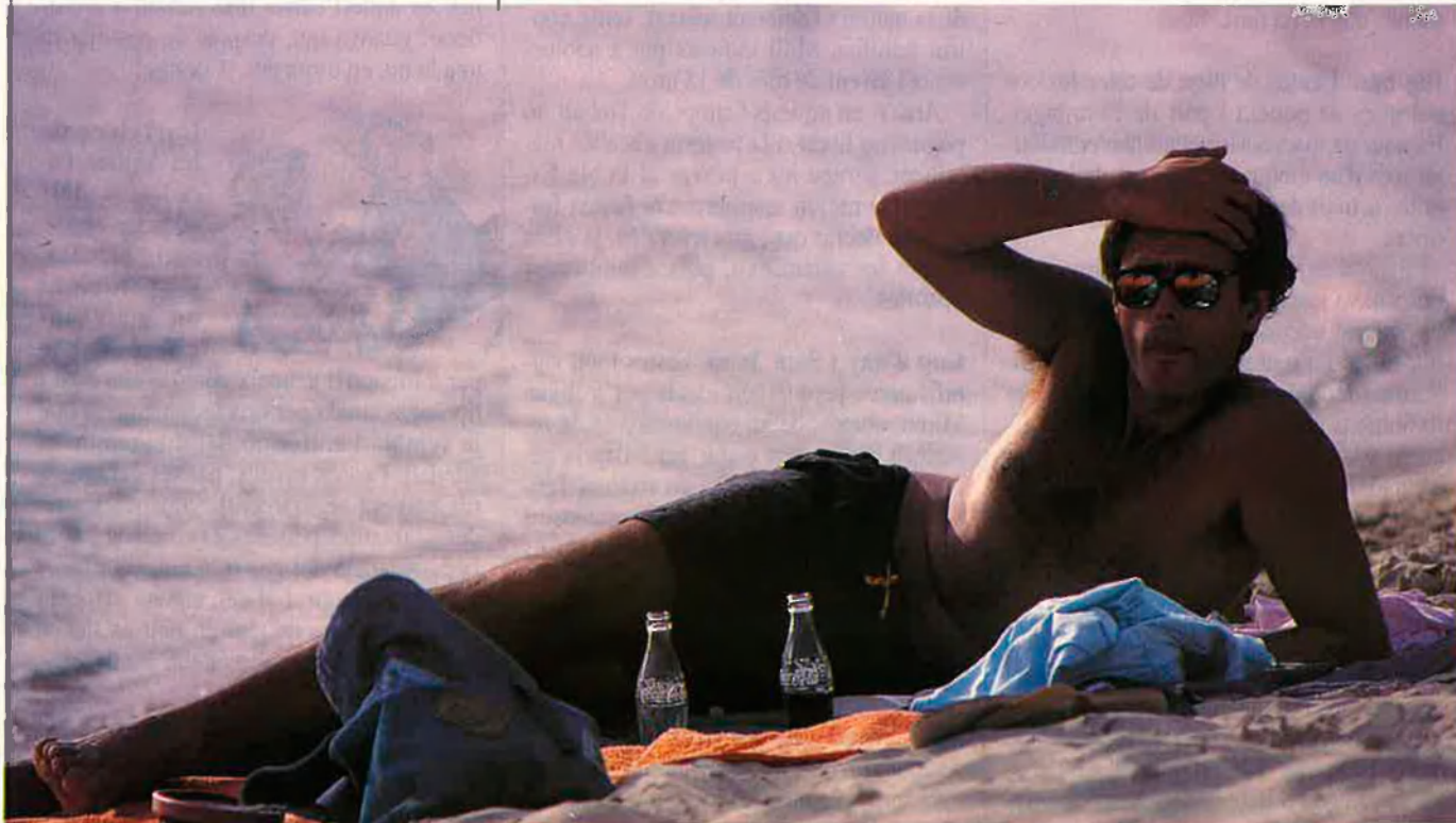
L'oci de lligar.

xa i empenta, fan viatges a Benidorm, a les Balears o a les Canàries que organitza l'Avi Turista o La Caixa. Però n'hi ha que més s'estimen de treure el cap a sales de festa antigues per recordar vells temps i, si s'escau, tornar-ho a provar. Es pot dir que són qui més pesca, però difícilment ho rematen amb casament: ni la pensió dóna per a tant, ni gosen posar-la en perill.