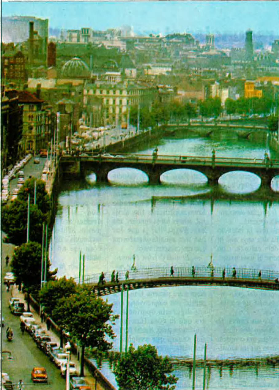
Joyce sempre tornava a Dublín en les seves obres.