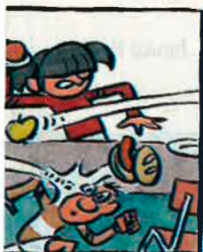
Menjador: 6.000-8.000 ptes.