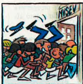
Activitats extraescolars: 5.000-15.000 ptes.