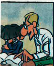
Classes particulars: Assignatures de lletres, 800-1.000 ptes./hora Assignatures de ciències, 1.500-2.000 ptes./hora