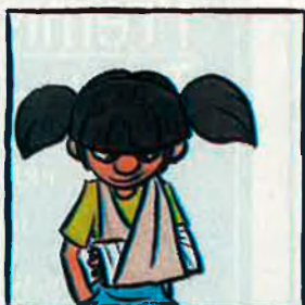
Assegurances: 2.000-3.000 ptes

voltant de 900 alumnes. Per al curs actual es calcula un nombre similar d'aquestes ajudes escolars de l'ajuntament.