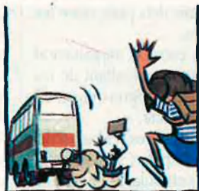
Transport escolar: 5.000-8.000 ptes.