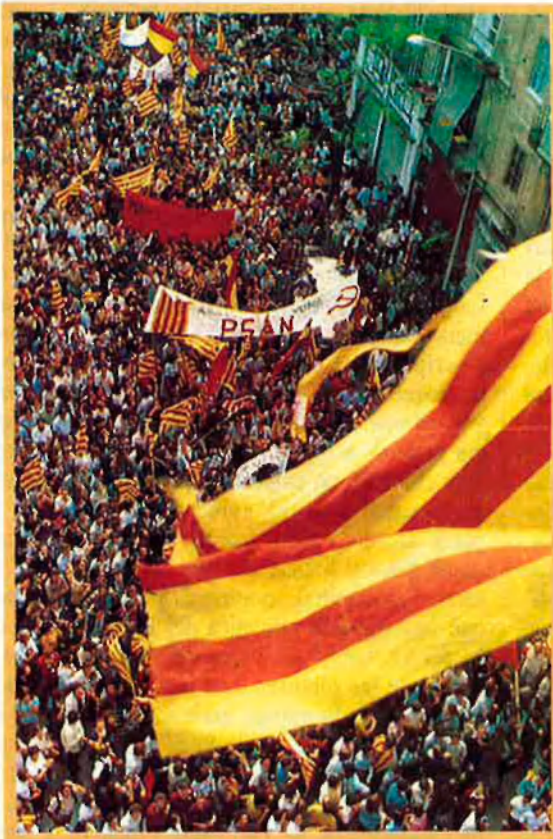
El 9 d'Octubre de 1977, mig milió de persones al carrer defensant l'autonomia.

No ha estat casual que València s'hagi quedat al marge de l'eix Barcelona-Madrid-Sevilla. La via estatutària de segona ha donat un país instal·lat en segona fila.