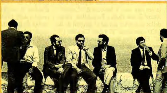
Relax vora el mar.

Manuel del Hierro, un dels homes forts d'aquell moment en el PSOE no havia volgut entrar en la llista perquè anava segon. Dos eren massa i van ser set diputats del PSOE, encapçalats per Josep Lluís Albinyana, els que entraven en les Corts a Madrid. El PSOE arrasava, seguit de la UCD amb cinc diputats. El vot nacionalista obté 47.512 vots d'Unió Democràtica del País Valencià i 29.569 vots del PSPV, que havia sofert una escissió pocs mesos abans. Albinyana comença a ser l'home públic del País Valencià