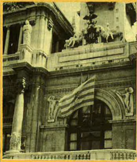
Dalt, la comissió que va redactar l'Estatut de Benicàssim. Baix, el vent fa que la senyera del Consell tapi la bandera espanyola.