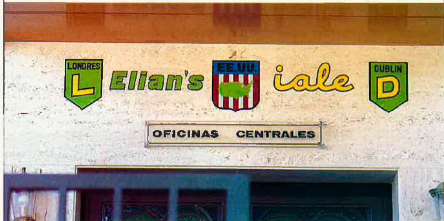
Instal·lacions del col·legi Iale.

família reial amb Villapalos per fer arribar al monarca les tesis que ell i la seua academia —en aquell moment encara no era Real — propugnen. A la vegada, el mateix rector mostra davant la situació política valenciana dues facetes complementàries. D'una banda, el qüestionament, prudent però constant, de la realitat nacional; tal com ho demostra un recent article de premsa on afirma textualment que no entén "com hi ha valencians que admeten els Països Catalans, una vella orientació dels anys seixanta. Les llengües prenen la seua denominació del lloc on han tingut el segle d'or i a València va ser al segle XIV. La primera literatura escrita i impresa va ser la valenciana. La realitat geopolítica, cultural, històrica i econòmica de València ha estat diferent a la catalana i tenen els mateixos drets per a ser autonomia històrica". De l'altra, aquest discurs bi-