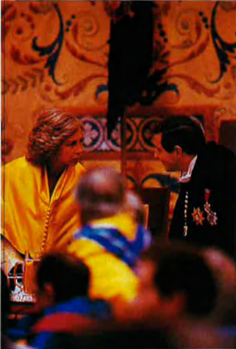
La reina Sofia durant la investidura de Gustavo Villalpos.