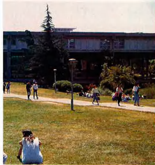
Universitat de les Balears.

Tant el BEI com la FNEC han expressat la seva satisfacció pels resultats de les eleccions a la Universitat de València, on les opcions nacionalistes han obtingut grans resultats, acompanyats de la descomposició de l'espai electoral de l'ultradreta. El Bloc d'Estudiants Agermanats (BEA), de tendència nacionalista i progressista, ho ha arrassat literalment tot fins a aconseguir 41 claustrals dels 108 possibles. El BEA ha estat l'única asso-