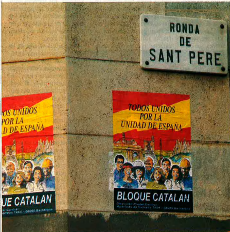
Imatges dels cartells del Bloque Catalán enganxats als carrers de Barcelona.

El Bloque Catalán, després d'aquesta primera campanya de cartells, prepara un acte públic de presentació a Barcelona. Per ara ha aconseguit reagrupar un contingent important dels grups de l'extrema dreta del Principat. És una experiència pilot que no preveu de moment moviments semblants ni a València ni a les Illes, ni a l'estat. De moment, tal com diu l'últim paràgraf del document de constitució, "preguem a la Divina Providència perquè, si és la seva voluntat, poguem disposar aviat d'uns mecanismes amb què defensar amb possibilitats la nostra alternativa en favor de la Catolicitat i la Unitat d'Espanya".