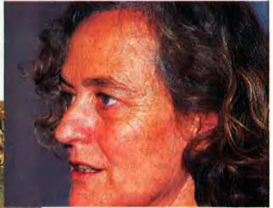
Els jueus de religió eren fora des de 1391. J. MORERA

—Pràcticament no es va notar. De fet, els jueus de religió ja eren fora des del